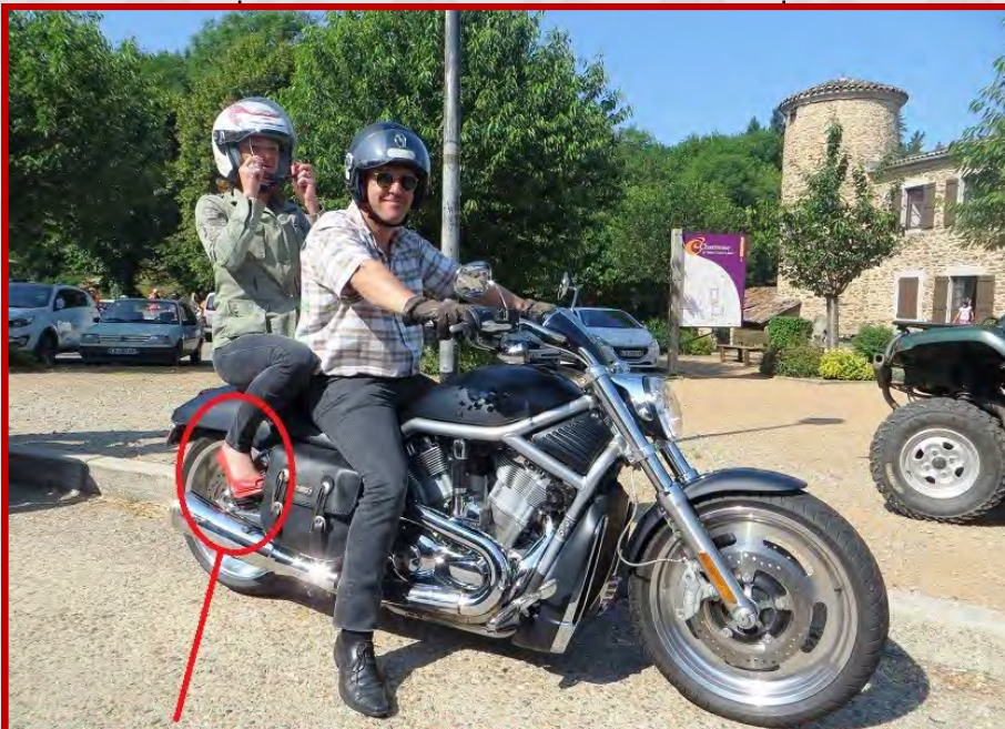
Vu lors de la sortie Open: le dernier modèle de chaussures moto vendu en concession

Ce matin-là, réveil 6h00, semblant de pique-nique jeté dans le sac à dos, douche vivifiante et nous voilà partis. Arrivés à Brignais, ça y est, nous étions dans l'ambiance. Un grand nombre de motos était arrivé. Puis l'organisateur a pris la parole pour donner les directives et nous