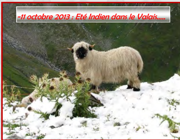
-11 octobre 2013 : Eté Indien dans le Valais.....